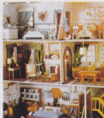
La Bottega dei Sogni: Settimo Torinese (TO); tel. 011.8970509